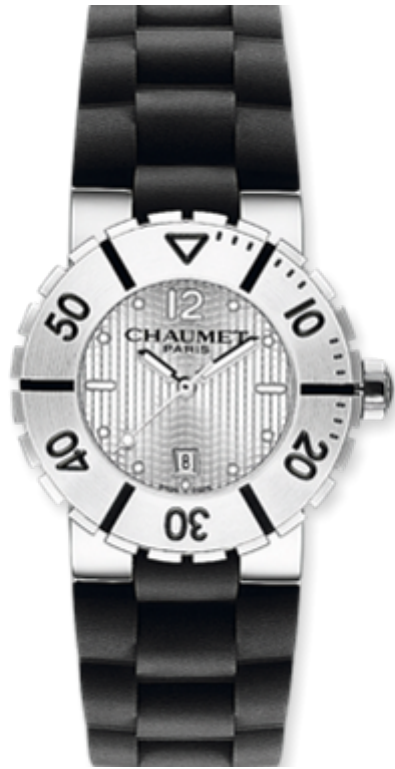
Montre Class One Moyen Modèle 3 010 €