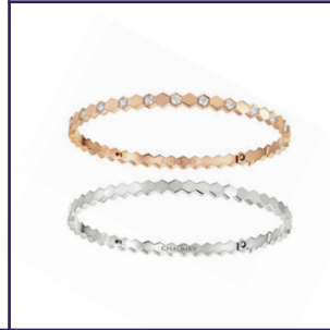
Bee My Love 手鐲